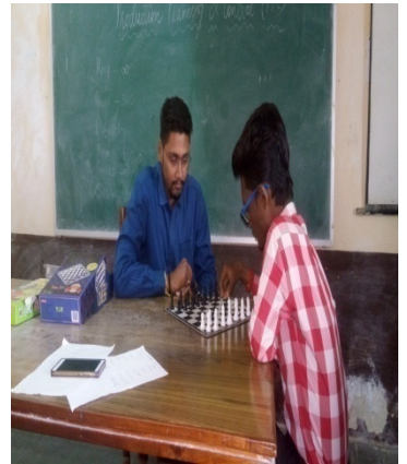
Photographs of Young Managers Club (YMC) Activities